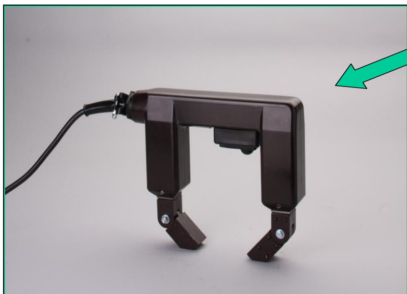
NC-Y 型 (ヨークを取付けた状態)