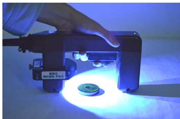
LED ブラックライト(別売) と組み合わせた使用例