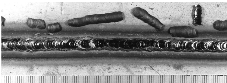
TGF308L 应用实例(无背面保护的背面焊道)

TASETO “TGF 系列”是新开发出来的带有药皮的 TIG 填充棒,用于不锈钢焊接接头的底层焊接。由于药皮的保护作用,不需要在背面附加气体保护,仍可以得到无缺陷的背面焊道。