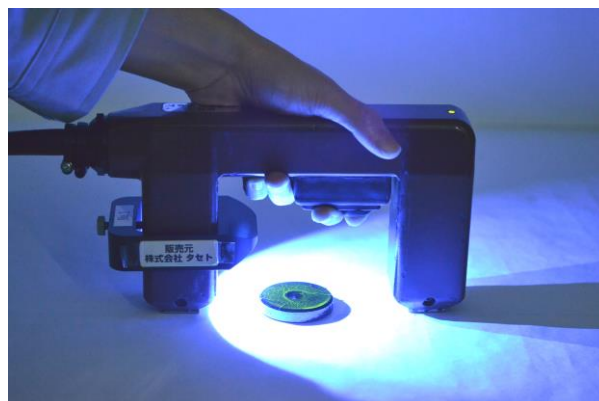
ブラックライトNU-61(P) (装着・点灯)