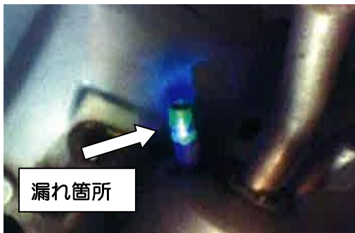
図 1 : 空調の冷却オイル漏れ